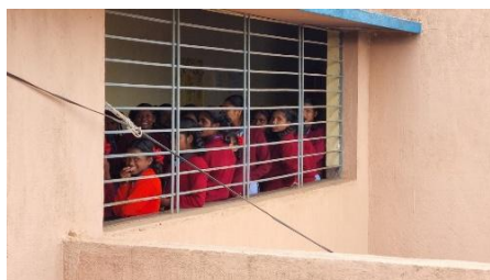
Befreite Mädchen in einem von CSI betriebenen Schutzhaus im Osten Indiens

CSI kämpft in Indien mit verschiedenen Mitteln gegen den Menschenhandel: Es betreibt Präventionsarbeit in Kirchen und Schulen, fördert Netzwerke gegen den Menschenhandel und setzt sich für die Befreiung und Integration der Opfer ein. Die CSI-Partnerorganisation betreibt zudem ein Rehabilitationszentrum, in dem derzeit ungefähr 30 befreite Mädchen Schutz finden, wo sie auch eine Schule besuchen können und psychologisch betreut werden.